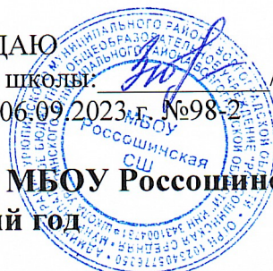
График проведения оценочных процедур МБОУ Россошинская СШ на 2023-2024 учебный год